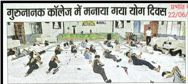
गुरुनानक कॉलेज में मनाया गया योग दिवस प्रभात 22/06/